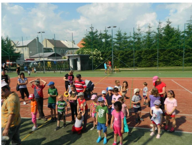
Dětský den SDH Náklo