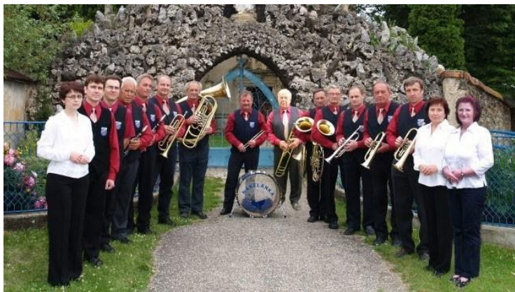
Dechová hudba Nákelanka