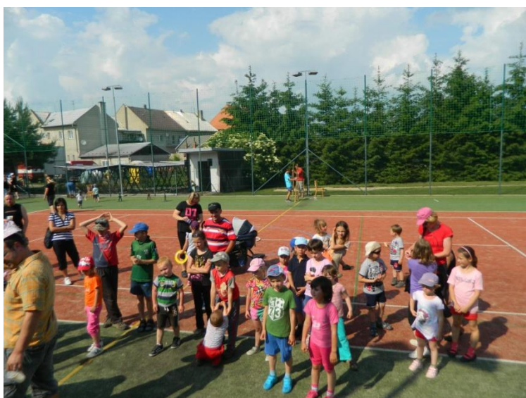
Dětský den SDH Náklo