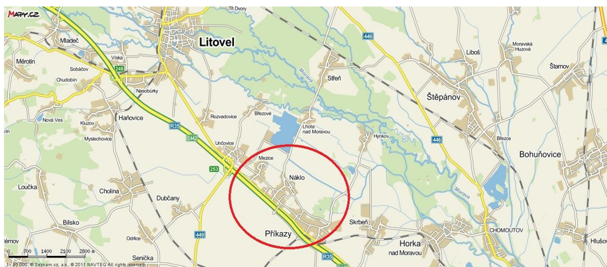
Obrázek 1 - Poloha obce

Katastrem obce protékají potoky Cholinka, Roudník, Mlýnský potok a nachází se v něm pískovna Náklo.