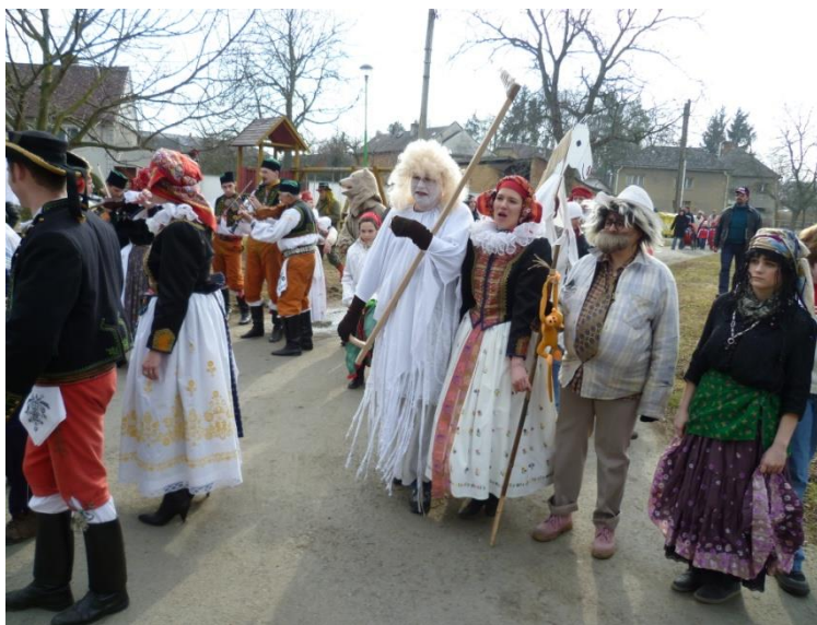
Národopisný soubor Pantla